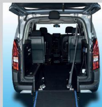
Aménagement intérieur optimisé pour 4 places assises + 1FR

Moderne, attractif, modulable Polyvalent avec ses 2 versions Standard et Long Convivial et confortable pour tous