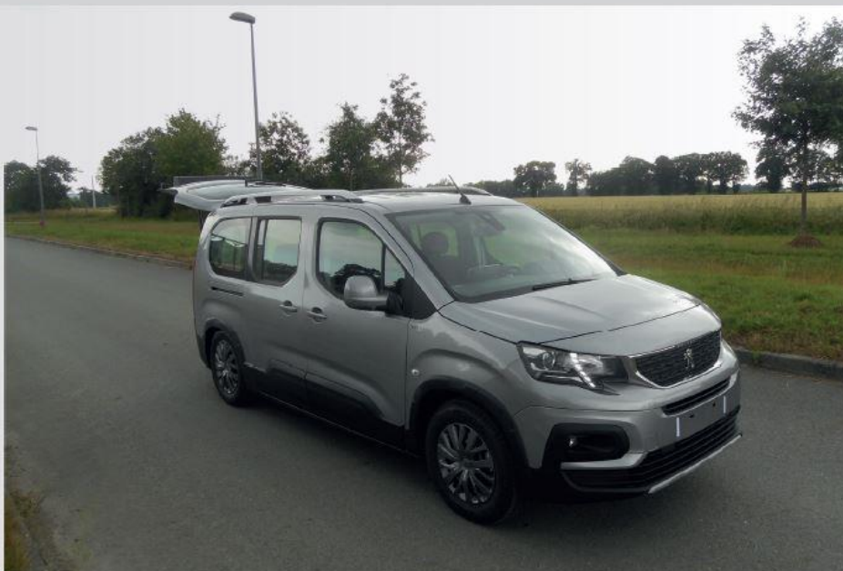
RIFTER LONG HANDI'AIR TPMR