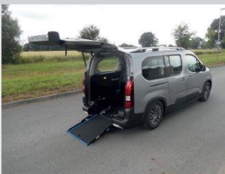
Handi'Air avec une rampe courte grâce à l'abaissement arrière